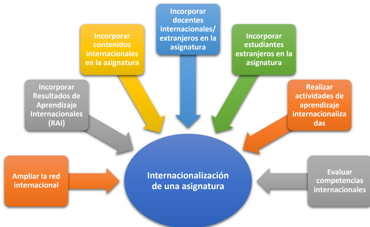
Figura 1. Estrategias para internacionalizar una asignatura Elaboración propia